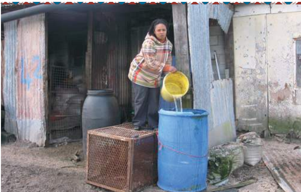
Water verzamelen met de hand, een rug brekend klusje