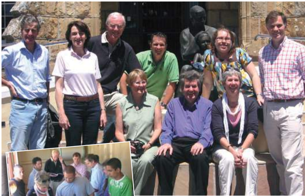
In het najaar van 2008 hadden we bij Breadline Africa alle international bestuursleden op bezoek.